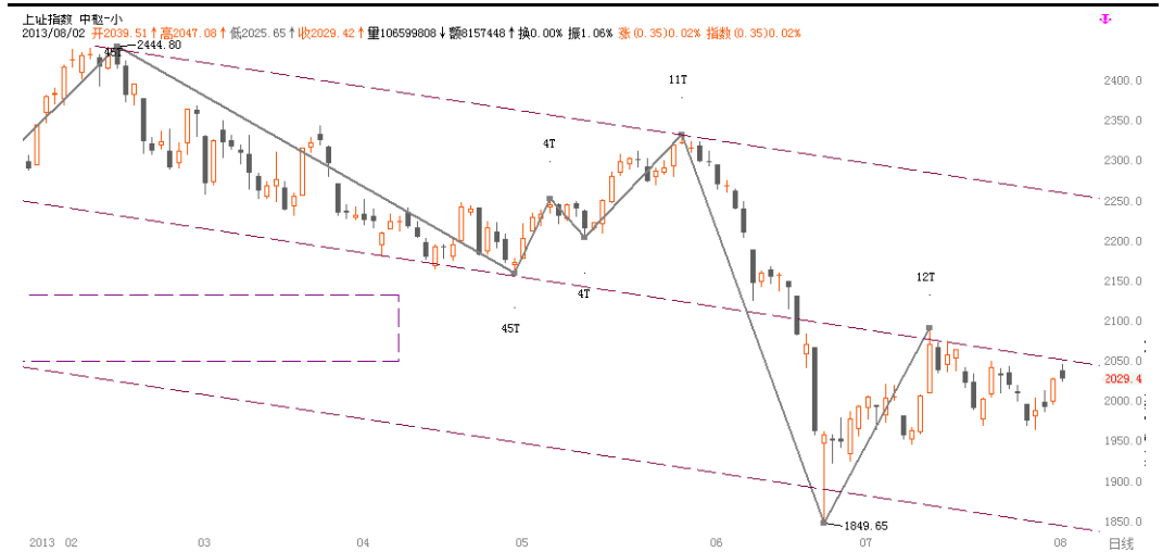
图1-1: 上证日K线图: 2050的中轨处形成压力

综合来看，外围相对利好，且房产税或落脚于增量住房，较好于预期。技术形态方面，股指上周放量收复短期的三条均线，日级别MACD也重回上升格局，暂时虽有中轨的阻力，但震荡蓄势之后，仍有上冲的动能。操作上，建议上周入场的多单继续持有。