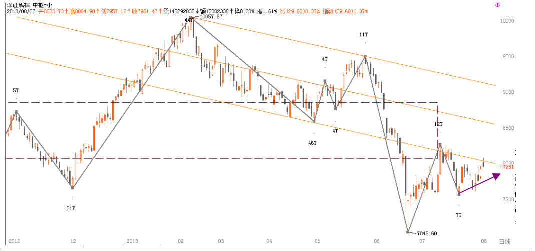
图1-3:深圳成指日线行情级别分段: 深市走势及分段与上证一致, 处于空转多临界