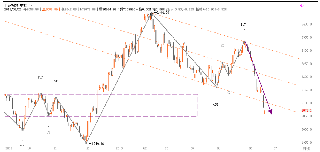
图1-3: 上证指数日线行情级别分段: 再启下跌波段

为使得研究的结果更有现实意义, 我们界定政策转向的时间点为 2010 年 10 月, 采用日线级别点位重新划分紧缩政策实施以来的市场形态与时间区间。(更详细解释请参考《考虑市场情绪后的高 Alpha 股票选取——股指周报附件》)