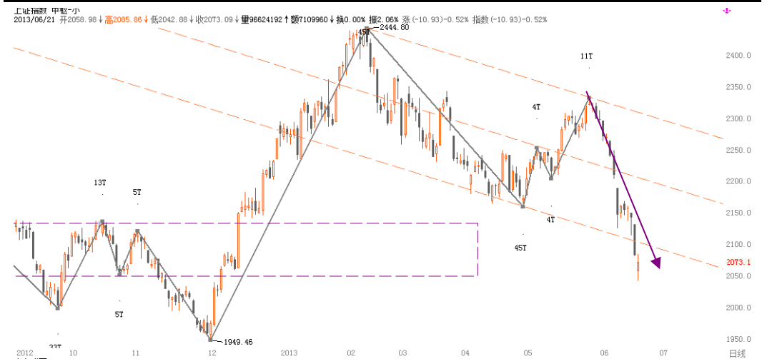
图1-2: 上证周K线图: 2050处产生一定支撑