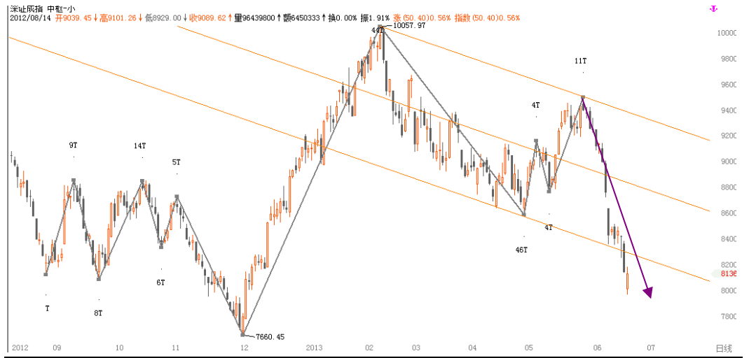
图1-4:深圳成指日线行情级别分段:再启下跌波段