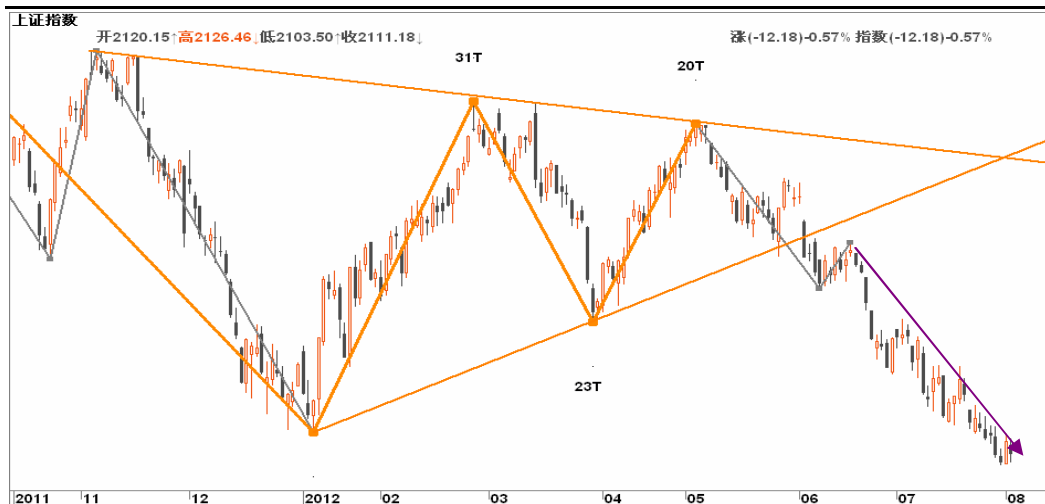
图2-2: 上证日线图：连续下跌时间较长跌势较缓，空头可逐步减轻筹码，到2050一线时可暂时离场