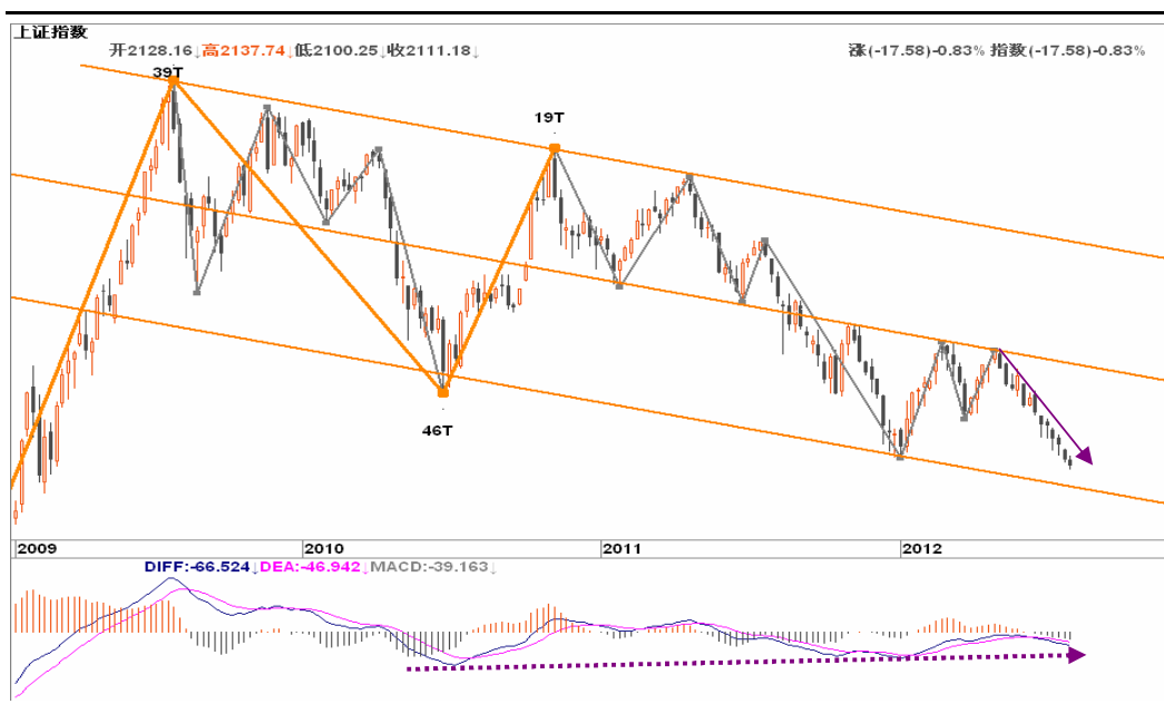
图2-1: 上证周K线图：下跌趋势延续，2050一带有所支撑，可关注位置与趋势背离的共振