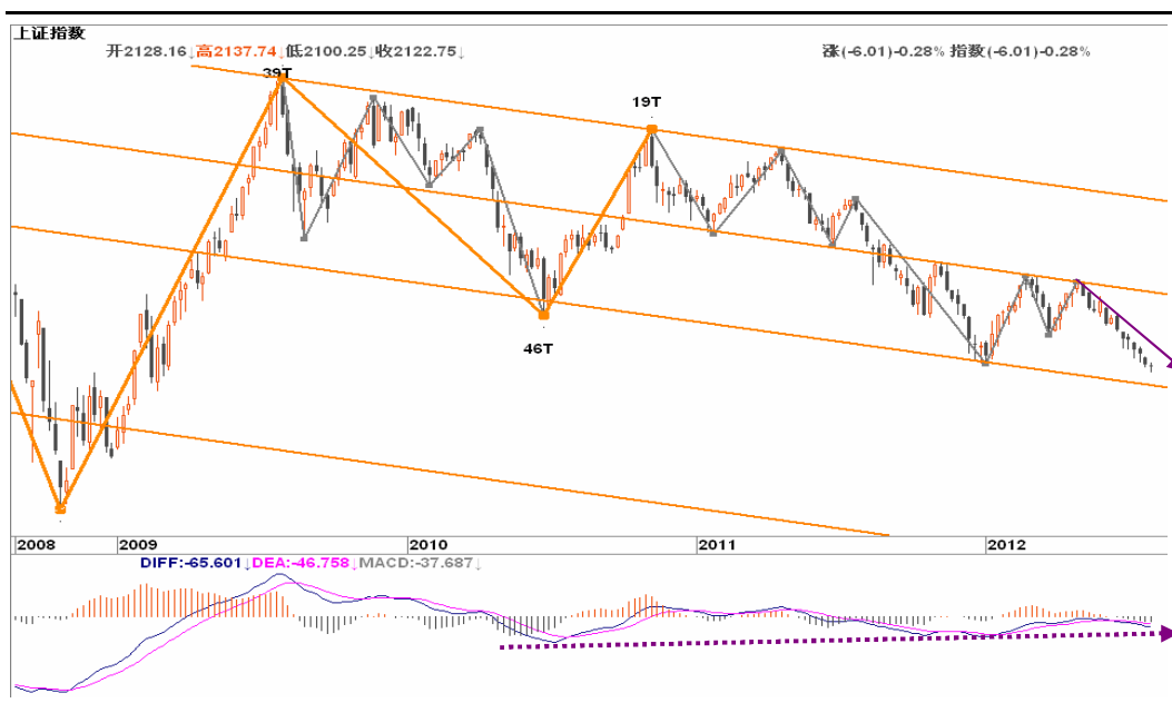
图2-1: 上证周K线图：下跌趋势延续，2050一带有所支撑，可关注位置与趋势背离的共振