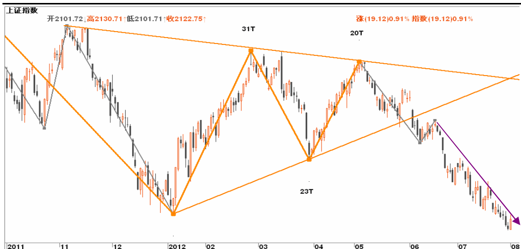
图2-2: 上证日线K线图：连续下跌时间较长跌势较缓，空头可逐步减轻筹码，到2050一线时可暂时离场