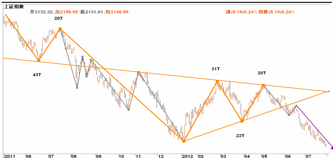
图2-2: 上证日K线图：连续下跌时间较长跌势较缓，空头可逐步减轻筹码，到2050一线时可暂时离场