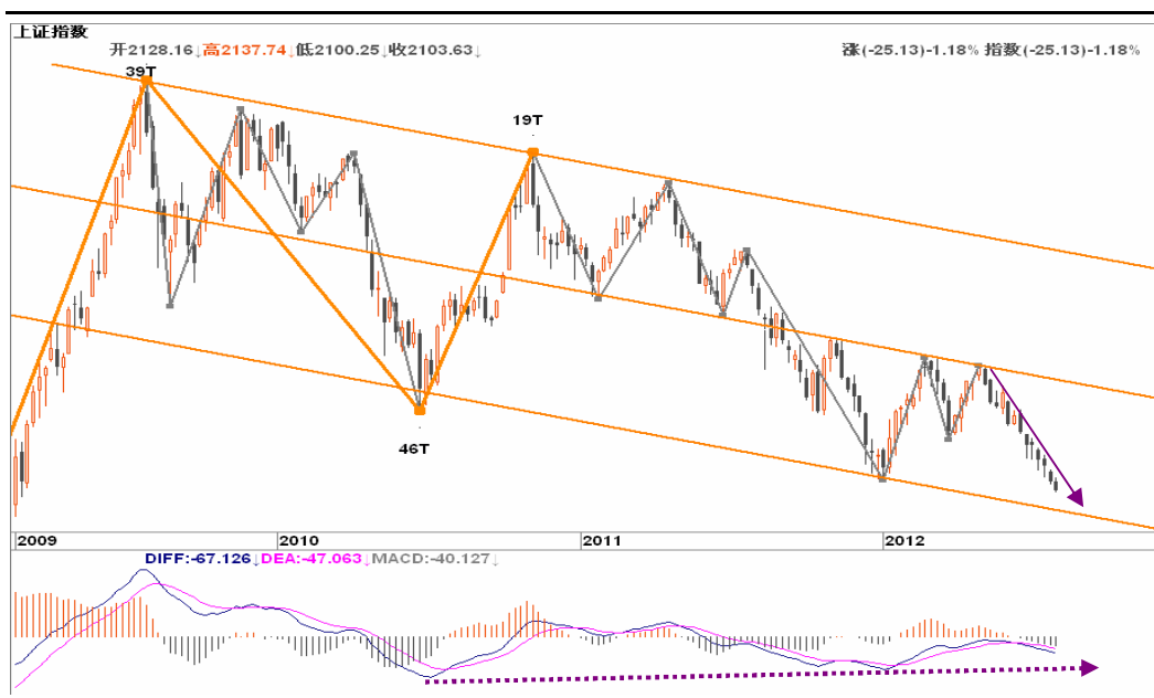
图2-1: 上证周K线图：下跌趋势延续，2050一带有所支撑，可关注位置与趋势背离的共振