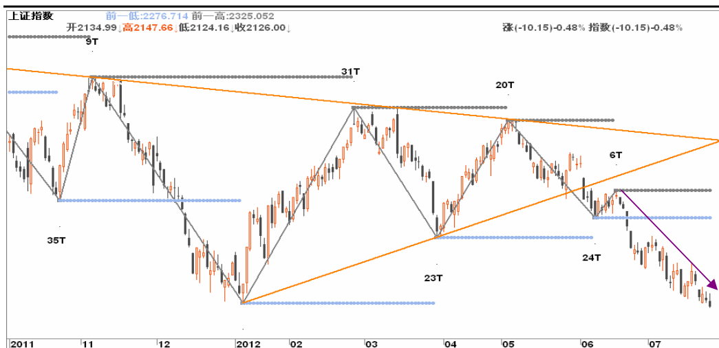
图2-2: 上证日K线图：钻石底告破，转势迹象未出现，但连续下跌时间较长，空头可减轻筹码