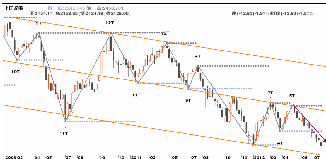
图2-1: 上证周K线图：下跌趋势延续