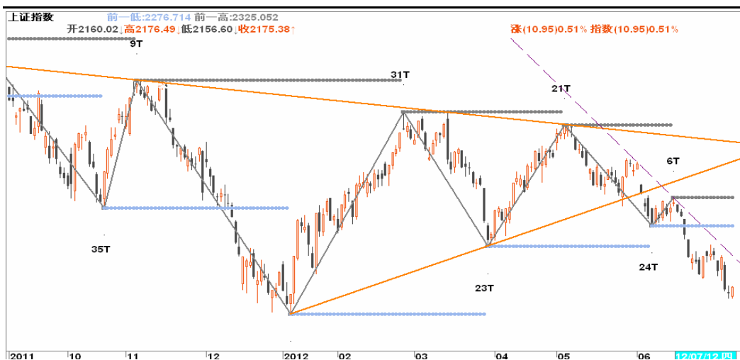
图2-2: 上证日K线图: 股指连续震荡下跌后, 即将考验1月份低点。