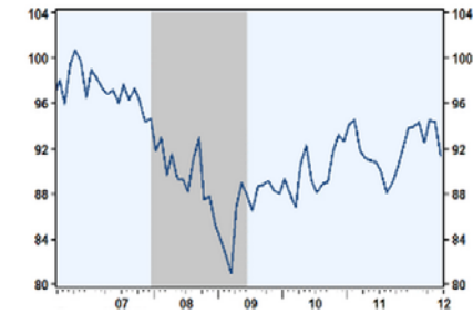
美国小企业主乐观指数下降