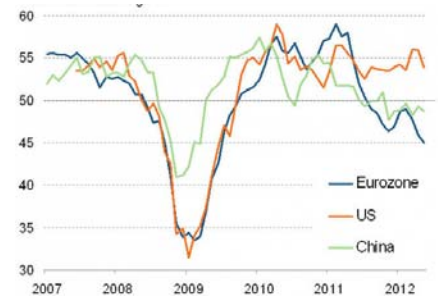
中美欧 PMI 对比