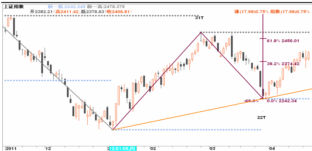
图3-1:上证日K线图: 在资金与经济低迷期, 靠银行或前期爆炒概念带动的上涨, 往往不具持续性