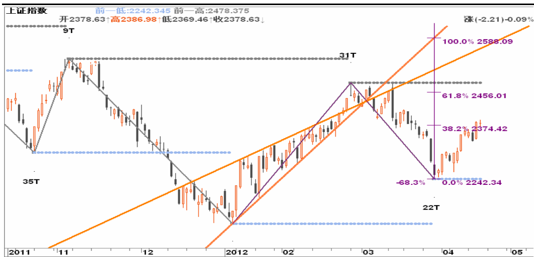
图3-1:上证日K线图: 金融创新概念退潮后, 在下一个热点接力前, 预计大盘将回归10日线寻求支撑