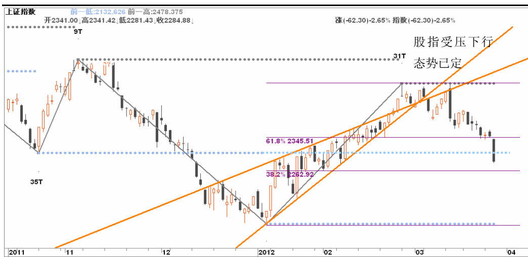
图3-1:上证日K线图: 股指维持震荡下行格局, 本周可规避反弹, 下周再待高而沽