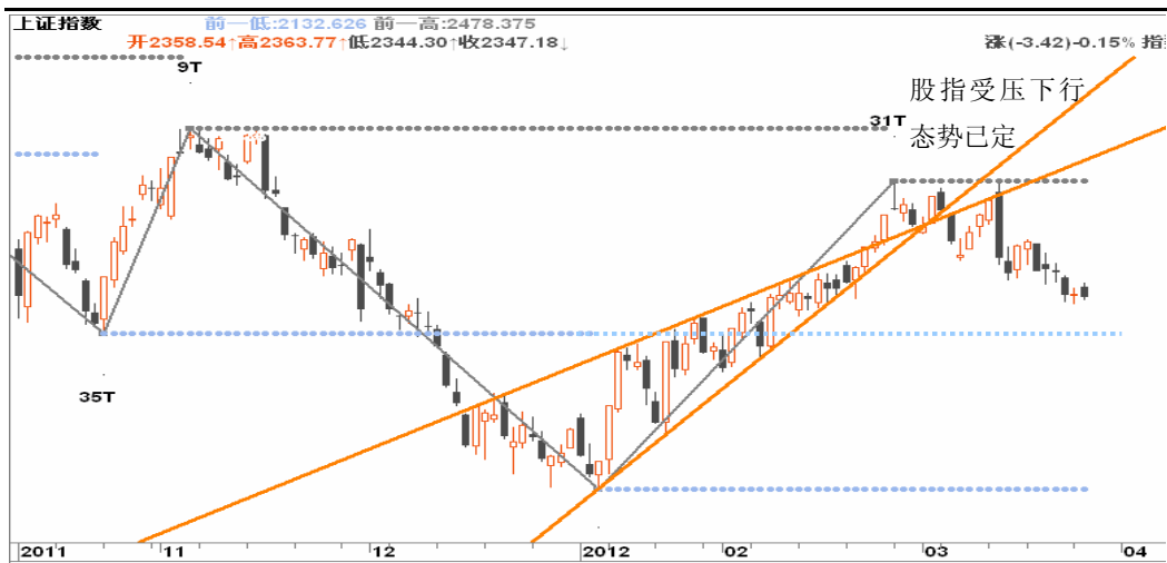
图3-1:上证日K线图: 股指维持震荡下行格局, 但本周或面临一定反弹