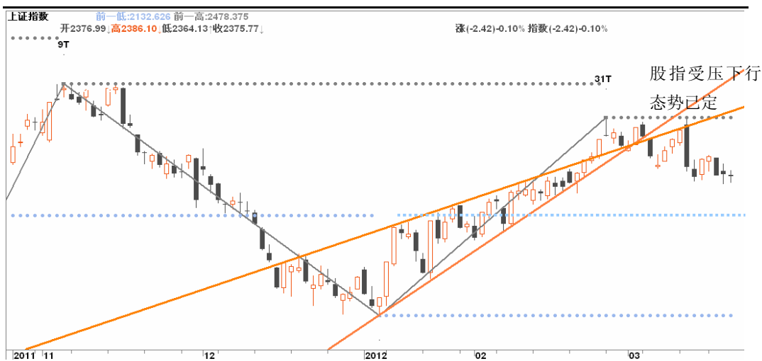
图3-1:上证日K线图: 股指下行大局几已确定