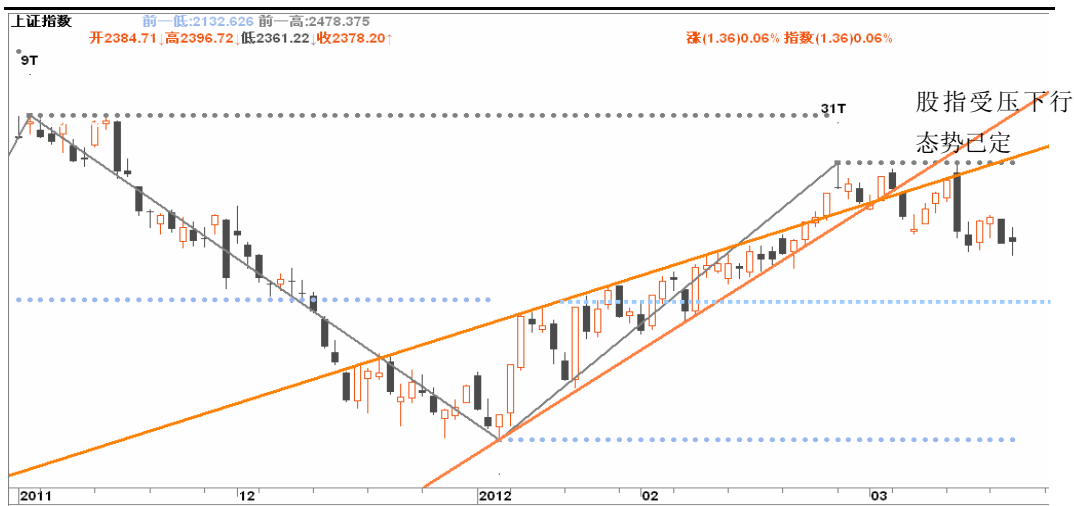
图3-1:上证日K线图: 股指下行大局几已确定