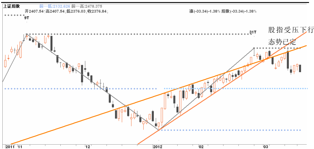
图3-1:上证日K线图: 股指下行大局几已确定