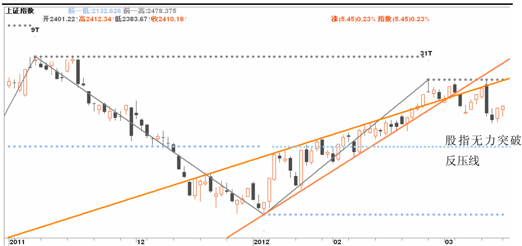
图3-1:上证日K线图: 股指近2日展开弱势反弹, 但应难改下行大局