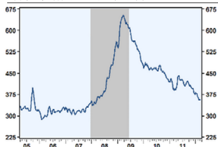
首次申请失业金人数下降