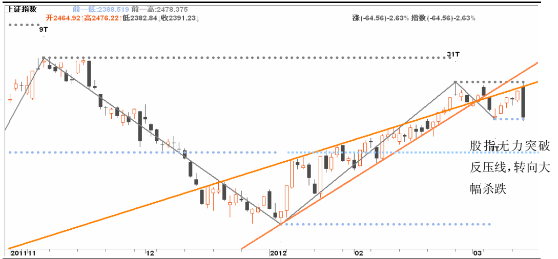
图3-1:上证日K线图: 股指受上涨趋势线的反压和前期高点压制, 配合两会的闭幕而大幅杀跌