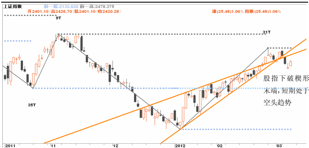
图3-1: 上证日K线图：股指下破楔形末端，短期处于空头趋势