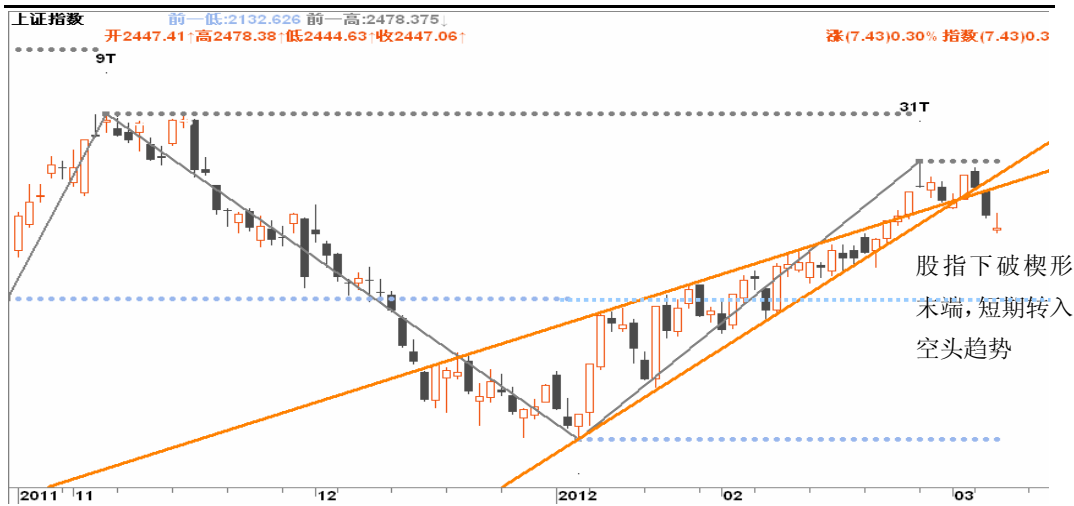
图3-1:上证日K线图: 股指下破楔形末端, 短期转入空头趋势