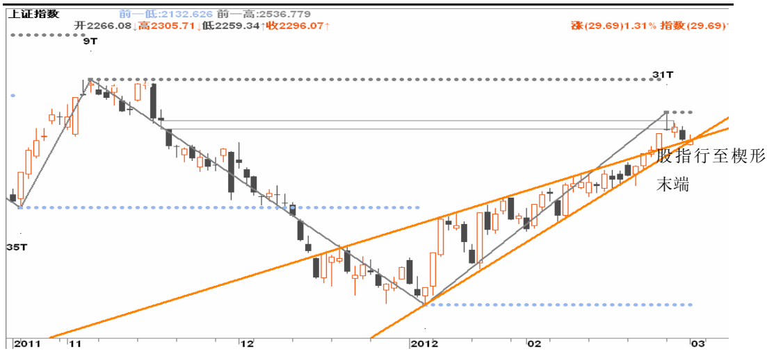
图3-1:上证日K线图: 在目前的点位, 继续做多的风险渐渐增大, 多单可分批离场。