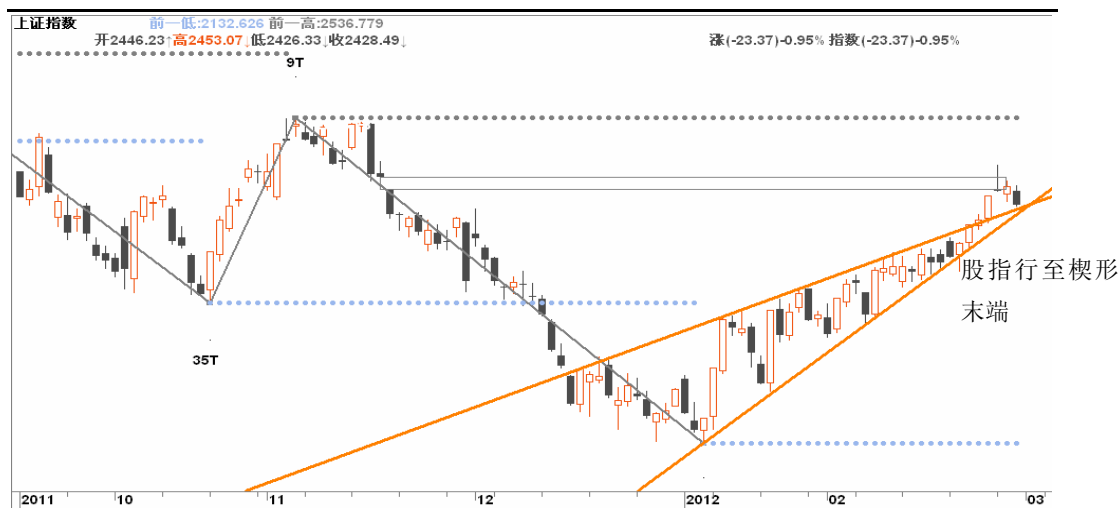
图3-1:上证日K线图: 在目前的点位, 继续做多的风险渐渐增大, 多单可分批离场。