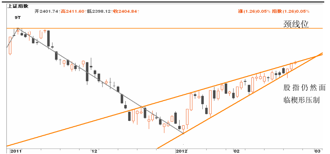
图3-1: 上证日K线图：自1月6日在子级别中形成的上升楔形仍制约市场