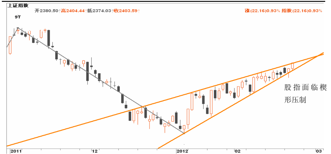
图3-1: 上证日K线图：尽管盘中希腊获得援助，自1月6日在子级别中形成的上升楔形仍制约市场

行情预判：日内交易（基于30分钟图表）：盘整/上行； 短线波段交易（基于日线图表）：盘整/下行； 中长线波段交易（基于周线图表）：盘整；