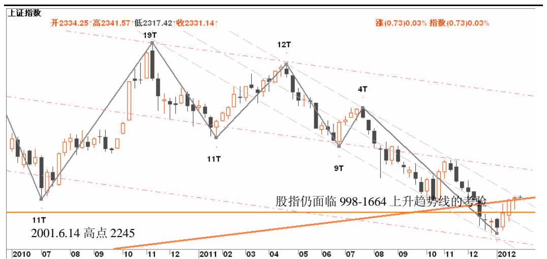
图3-1: 上证周线图：股指的反抽受到998-1664上升趋势线的压制