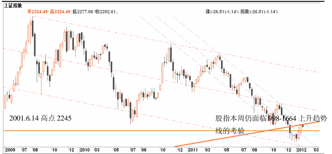
图3-1: 上证周线图: 股指的反抽受到998-1664上升趋势线的压制