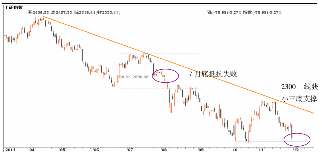
图5-1: 上证日线图：指数展开反弹之时，注意观察当时的领涨板块

本周外围风险事件方面，周周四则是西班牙和法国的国债标售时间，另外斯洛伐克也将发行1.5亿欧元国债。此外欧洲央行将在12月8日宣布财长会议政策决定，以及12月9日将举行欧盟峰会。