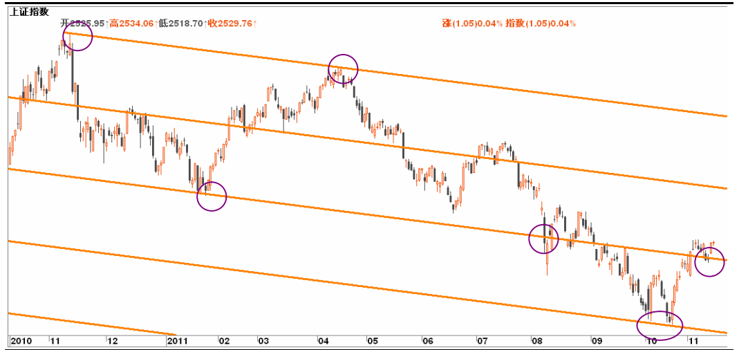
图4-1:上证日线图: 短暂调整之后, 预计未来仍有再次上涨机会