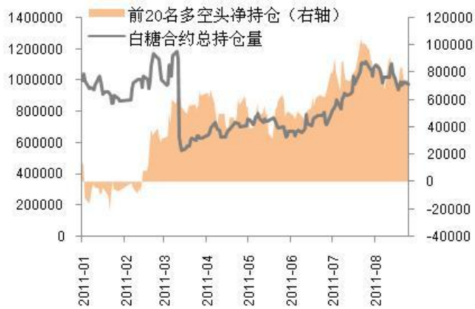
图3-3：白糖期货持仓量