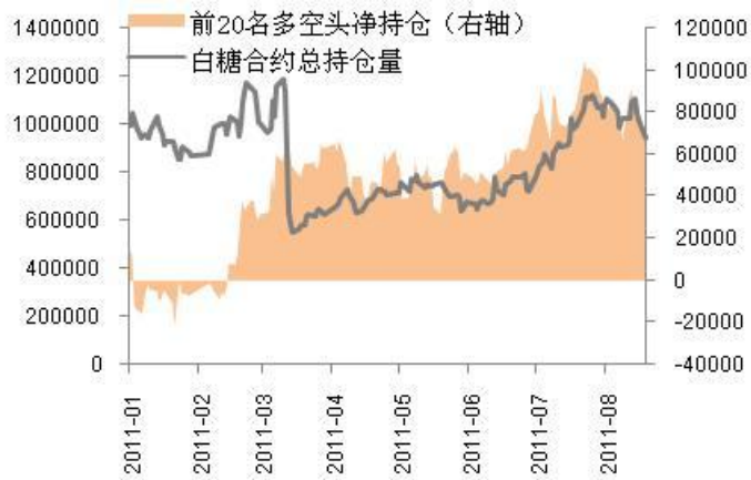
图3-3：白糖期货持仓量