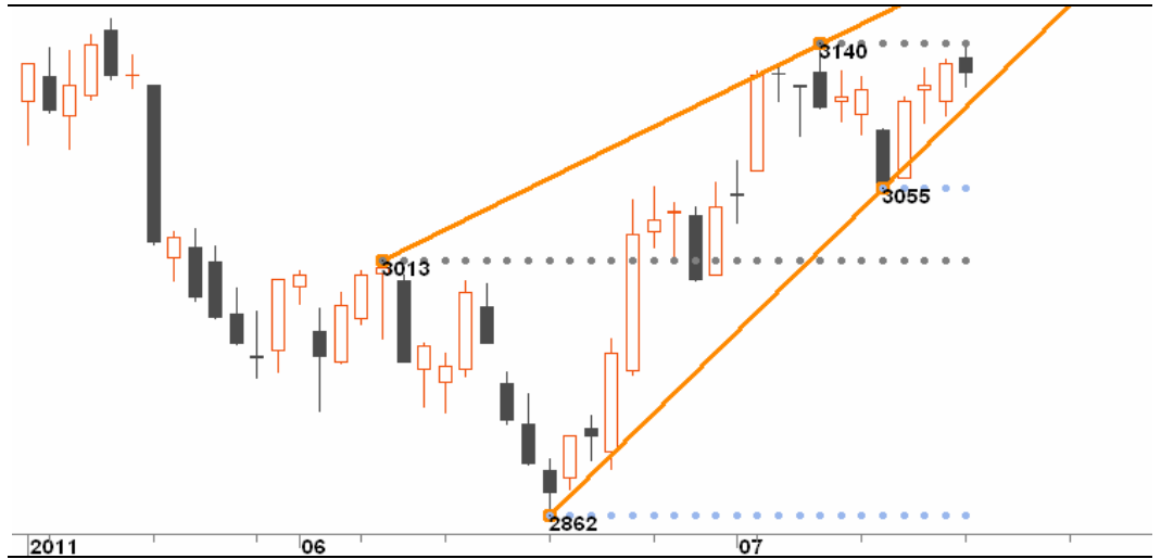
图4-1:沪深300指数日线图——关键形态位

合压制，难以有效突破，仍需经历震荡消化前期获利盘。但需盘中及时关注，如放量突破 3160，则可追加多单。今日看来，日内行情转向震荡，而中长线趋势则在本周进入趋势转换的临界点，在此时间窗口周 K 线易现大阳或大阴形态。（李斌）